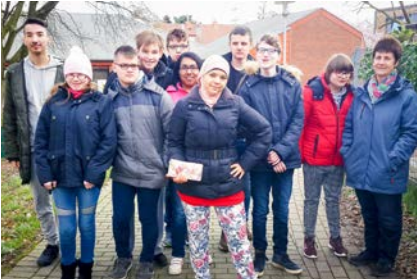
Gemeinsam unterwegs in Dortmund

Beispiel nicht nur mit fehlender Barrierefreiheit, sondern auch mit verspäteten Bussen und Bahnen konfrontiert. Gerade der erfolgreiche Umgang mit diesen Situationen gibt den SuS das nötige Selbstvertrauen, eigenständig die öffentlichen Verkehrsmittel zu nutzen. Sie erlernen auf diese Weise wichtige Handlungsstrategien für ihren Alltag. Um die eigenen Wege und Strecken zu planen, nutzen die SuS das Internet und Computer, wodurch sie zusätzlich ihre Medien- und Informationskompetenz schulen.