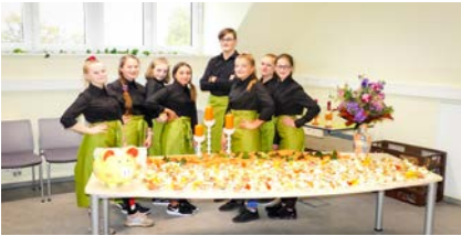
SuS der „NEW 1906“ am Buffet

dungsprozess und die Gestaltung der Schule mit einbeziehen. So entsteht ein Raum für SuS, aber auch für Lehrerinnen und Lehrer, in dem sie sich wohlfühlen und neben Obstspießen, Bagels mit frischem Gemüse und Vollkornbrötchen, auch einen Rückzugsort zum Reden und Entspannen finden. Dabei werden auch andere Gruppen aus der Schülerschaft mit einbezogen.