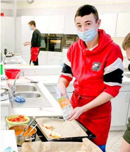
Schüler beim Kochen

möglichen Fallstricken zu entgehen. Außerdem untersuchen die SuS Werbestrategien im Allgemeinen, um den Einfluss auf ihr Kaufverhalten zu erkennen. Die SuS üben Verkaufsgespräche, wodurch sie ihre Informationskompetenz fördern. Dies ermöglicht ihnen, Kaufentscheidungen kritisch zu hinterfragen. Gemeinsam analysieren die SuS Angebote von Versicherungen und lernen, wie sie ihre erste eigene Wohnung einrichten können.