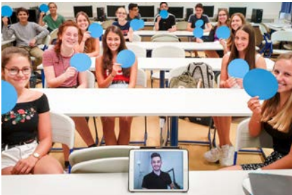
Seminar „Fit für Social Media“

Wie arbeiten eigentlich YouTuberinnen und YouTuber? Wie erzielen sie eine hohe Reichweite? Wie viel Aufwand ist es, einen eigenen YouTube-Kanal zu unterhalten und zu pflegen? Und: Kann man davon leben? Besonders interessant für die Teilnehmenden ist, dass der Referent einen Blick hinter die Kulissen gibt und aus eigener Erfahrung erzählt, worauf es bei der Produktion von YouTube-Videos ankommt, wie der Arbeitsalltag in einer YouTube-Redaktion aussieht und wie viel Arbeitszeit tatsächlich hinter einem 10-minütigen Clip steckt.