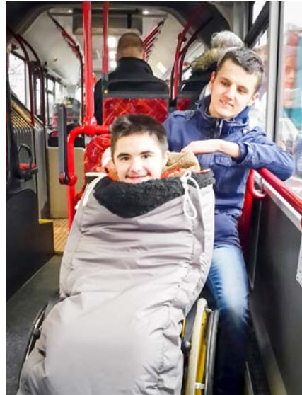
Die SuS meistern die Herausforderungen des öffentlichen Nahverkehrs

Arbeitsstätte allein zu bewältigen und stärkt sie somit für ihren weiteren Lebensweg.