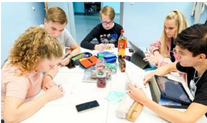
SuS bei der Gruppenarbeit

viel Aufmerksamkeit? Wie bringe ich die Kundschaft dazu, mein Produkt zu kaufen? Das sind nur einige Fragen, mit denen sich die SuS auseinandersetzen. Bei einem Besuch an der Hochschule Anhalt konnten die SuS mit der Eyetracking-Methode dann selbst erforschen, was die Blicke der potenziellen Kundinnen und Kunden anzieht. Dabei wird gemessen, wie lange eine Person auf einen bestimmten Punkt in einem Bild sieht.