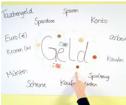
Gestaltetes Plakat zum Thema Geld

erfüllen können und welche nicht, ist dabei eine zentrale. Sie regt einen intensiven Austausch unter den SuS an. Dabei lernen die Kinder, dass nicht alles käuflich ist und sprechen intuitiv den immateriellen Wünschen eine höhere Wertigkeit zu.