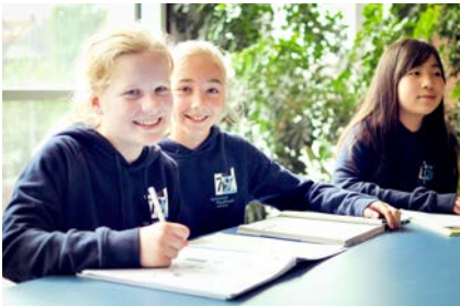
Schülerinnen mit den nachhaltig und fair produzierten Paulinum-Pullovern

Bei der Beschäftigung mit dem Bienenwachs entstand die Idee, eigene Naturkosmetik zu produzieren. Die Schulküche konnte genutzt werden, um aus Sheabutter, Kokosöl und Bienenwachs Lippenbalsam herzustellen. Dabei wurden nicht nur praktische Fähigkeiten, sondern auch Geduld und Konzentration der SuS gefördert. Anschließend wurde der Lippenbalsam nach den eigenen Vorstellungen der SuS aromatisiert.